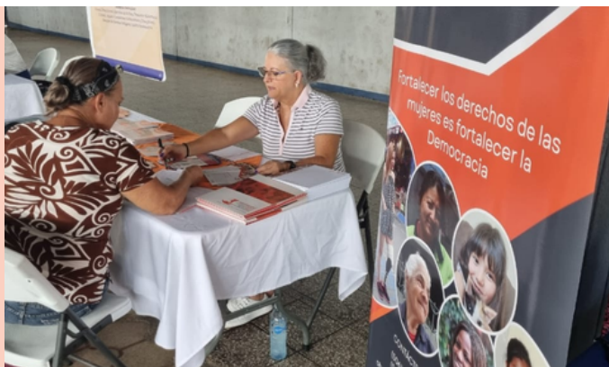
Pital de San Carlos